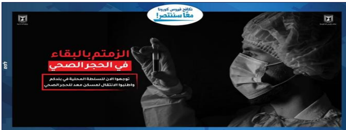
מתוך קמפיין משרד הפנים לחברה הערבית