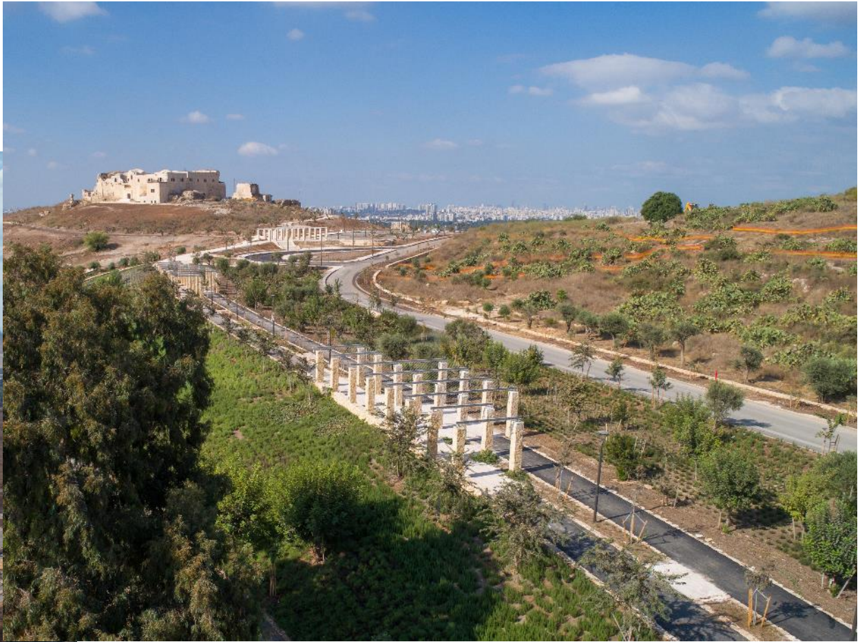
גן לאומי מגדל צדק. שיתוף פעולה עם רט"ג. נפתח 2019