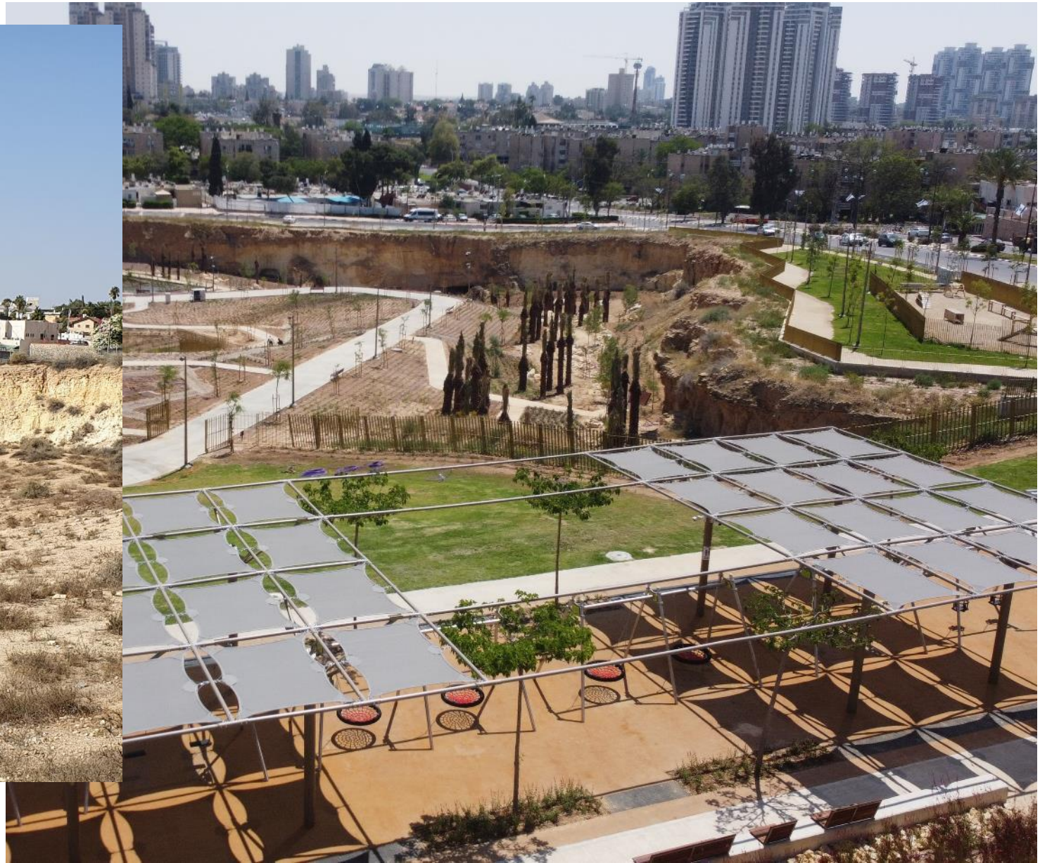
פארק המחצבה בבאר שבע - ממפגע למקור גאווה. נפתח 2023