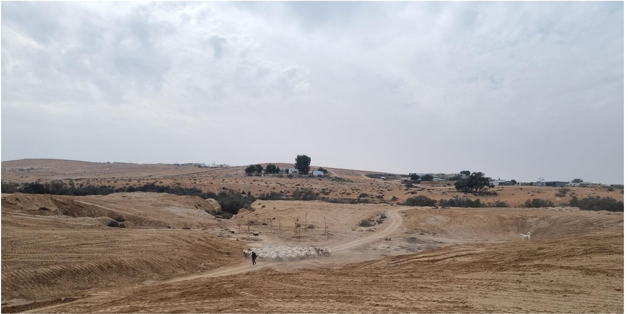
נחל רביבים מקטע ביר הדאג'. שיתוף פעולה עם רשות הניקוז. נפתח ב2022.