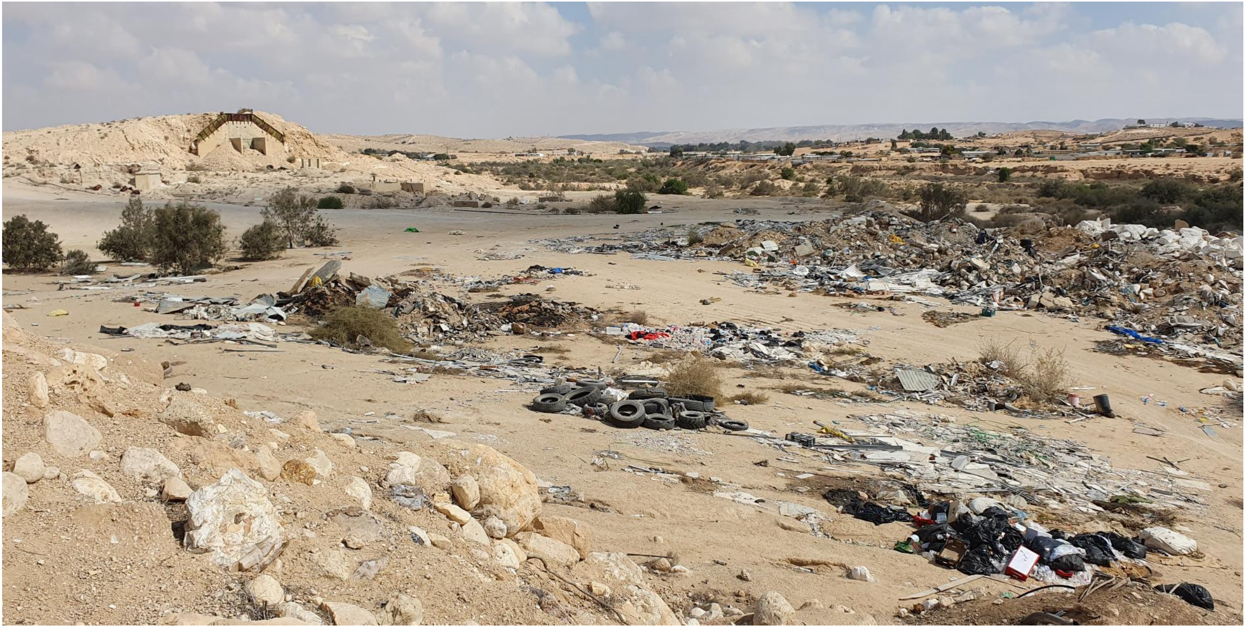
נחל רביבים מקטע ביר הדאג'. תמונות לפני שיקום