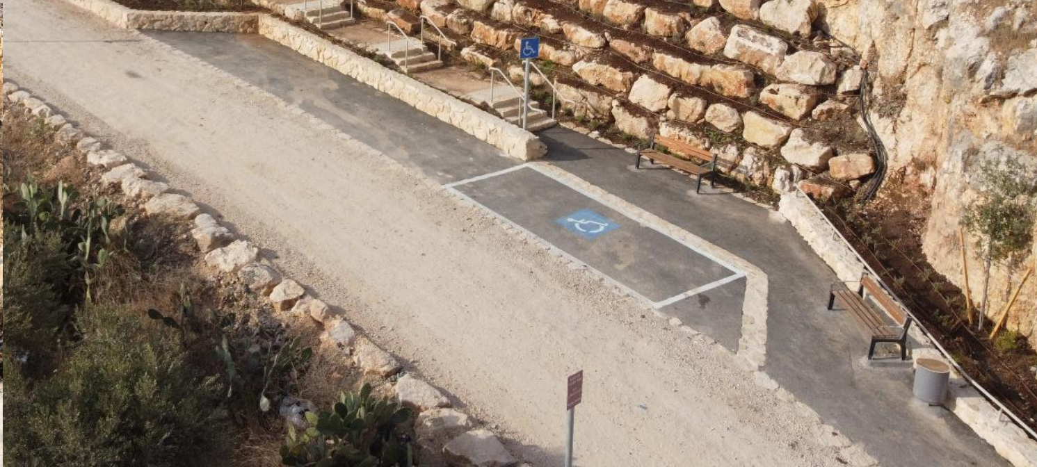
מג'ד אל כרום. שיתוף פעולה עם המועצה וקק"ל. נפתח בשנת 2022