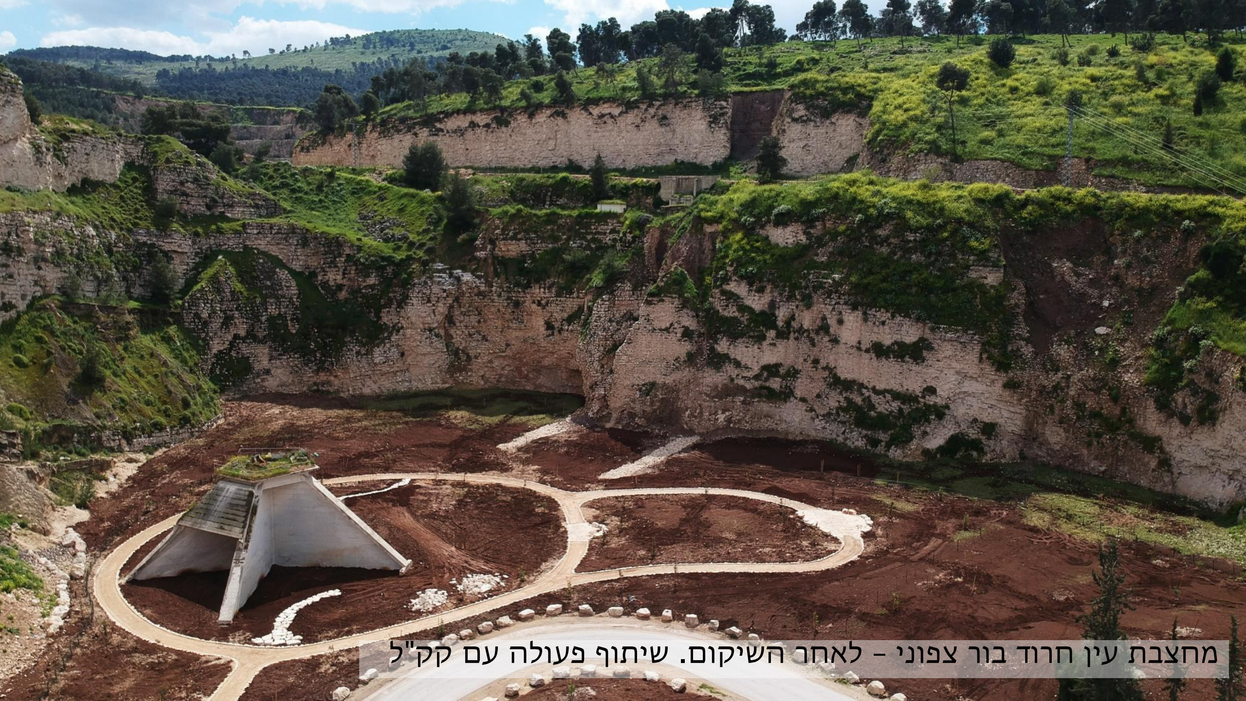
מחצבת עין חרוד בור צפוני - לאחר השיקום. שיתוף פעולה עם קק"ל