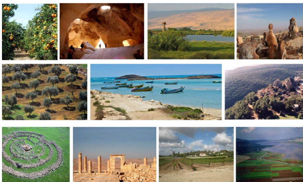
מגוון נופי התרבות בישראל, כפי שהוגדרו בעבודת "נופי תרבות בישראל" רטי"ג

כתוצאה מהנוף הטבעי המגוון ופעילות האדם בו לאורך אלפי שנים, גם הנוף מעשה ידי אדם-המשקף את תנאי המקום, הזמן והתרבות שיצרה אותו, הנו מגוון ועשיר במורשת תרבותית והיסטורית רבת פנים. השטחים הפתוחים הישראליים, הטבעי והחקלאי, כרוכים זה בזה ומיוצגים בנופים פתוחים המשובצים בנכסים היסטוריים בנויים ובמכלולים נופיים, המבטאים אורחות חיים יומיומיים, וערכיהם נקשרים בתולדות מקום, עם, מדינה וחברה.