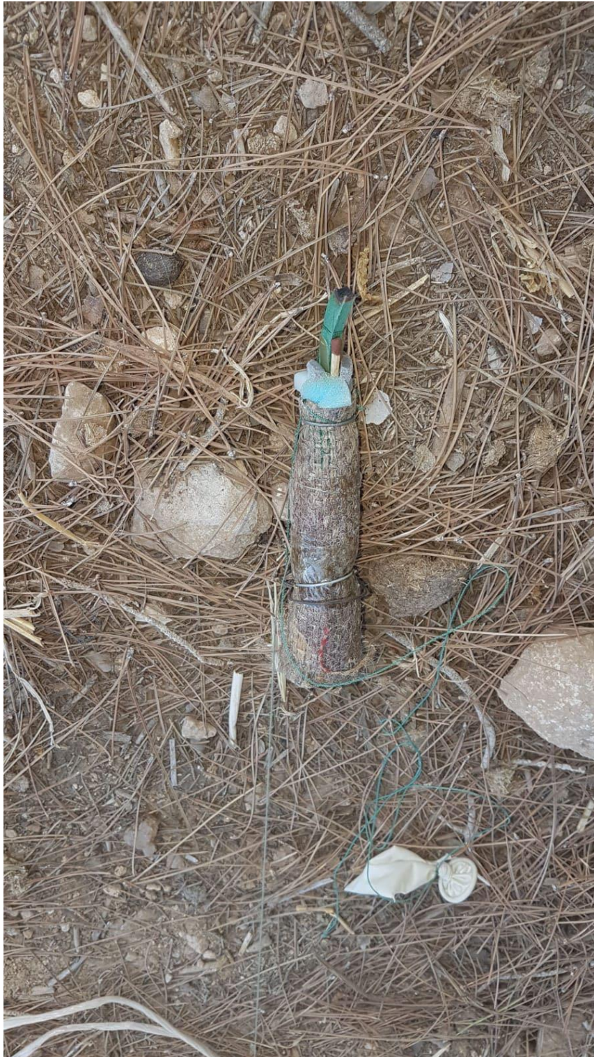
מערכת הצתה שהיתה מחוברת לבלון שנחת ביער באזור קרית גת