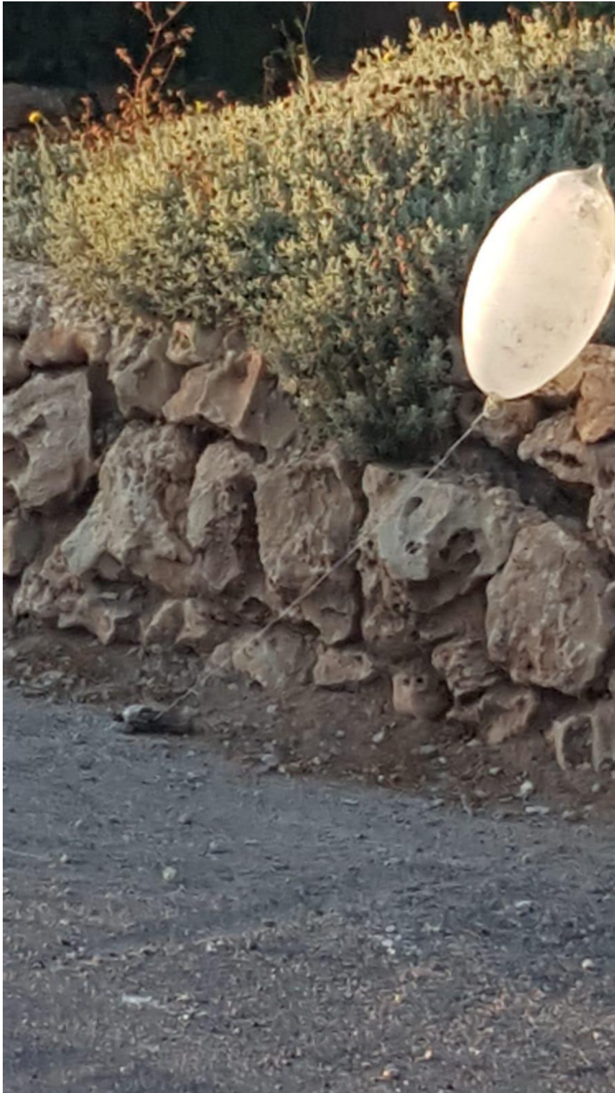
בלון תבערה שנחת ליד המושב כיסלון בהרי ירושלים